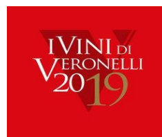
I VINI DI VERONELLI 2019 84 POINTS