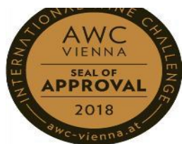
AWC VIENNA INTL. WINE CHALLENGE 2018 SEAL OF APPROVAL