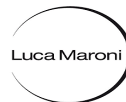
ANNUARIO "MIGLIORI VINI ITALIANI" 2019 89 POINTS